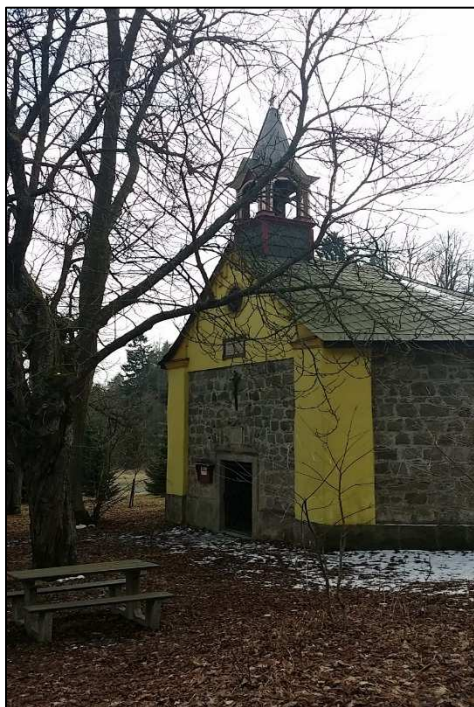
Kaplička sv. kříže pod Ostašem,