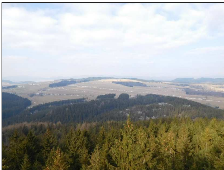
Výhled z Ostaše,