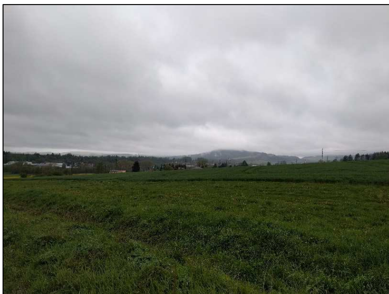
Panorama s masivem stolové hory Ostashe